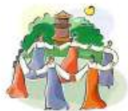
народное творчество (фольклор)