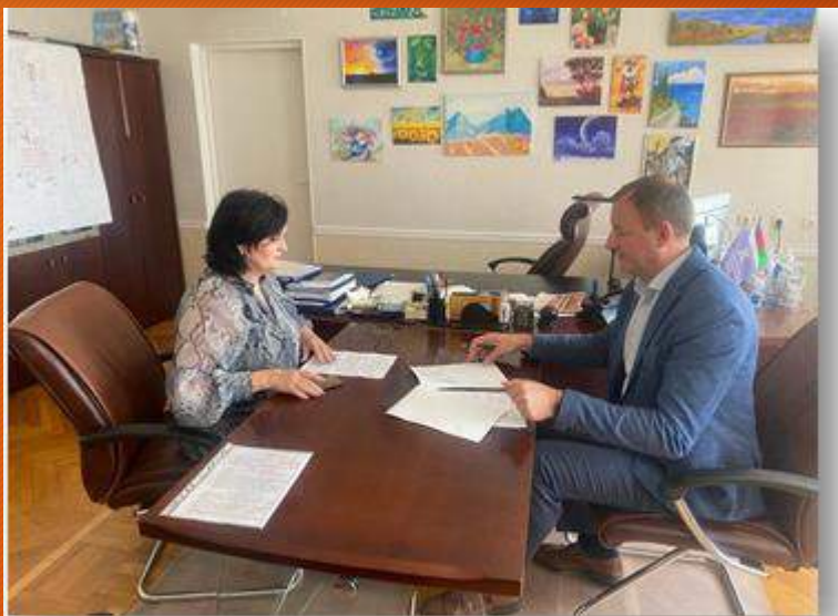
Соглашения о сотрудничестве с ведущими предприятиями в стране: "Кореновский МКК", ООО "Новация" и др.