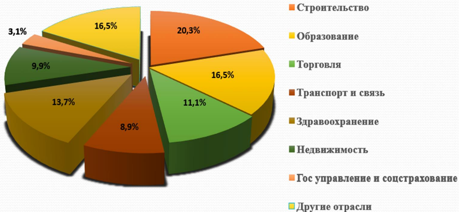
Межотраслевое перераспределение рабочей силы в г. Краснодаре