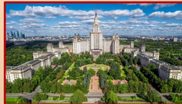
4. Московский университет