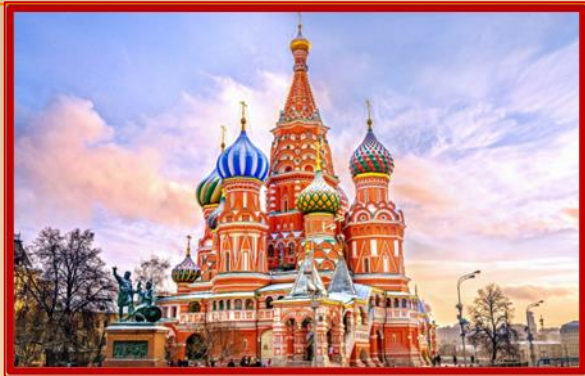
1. Собор Василия Блаженного