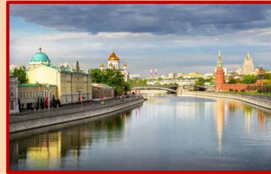
2. Река Москва