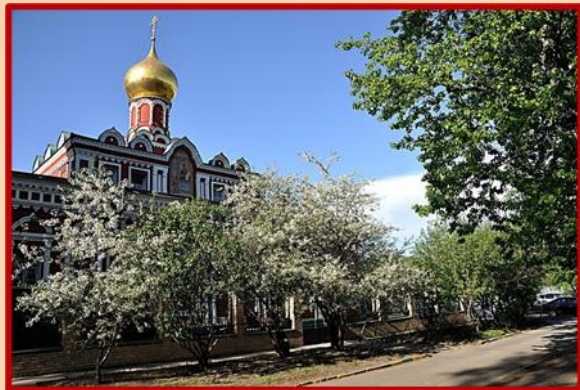
3. Марьяна роща