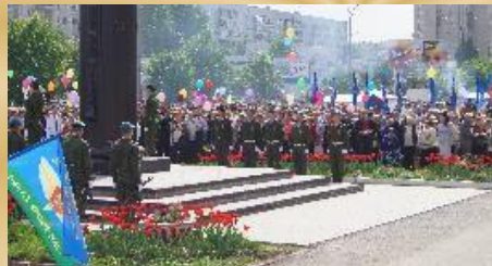
Юнармейские посты у Вечного огня, обелисков, мемориалов, участие в воинских ритуалах