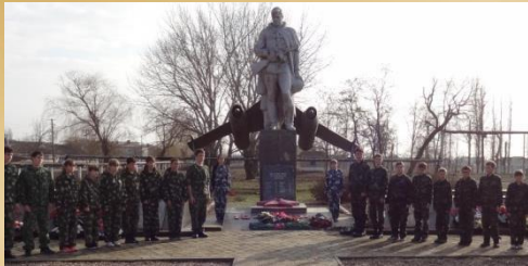
Профильные специализированные формирования юнармейцев (юных летчиков, моряков, десантников, танкистов, и другие)