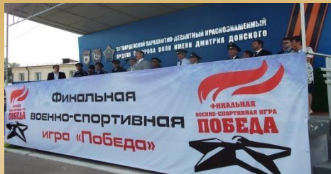
Всероссийские молодежные военно-патриотические игры, олимпиады, конкурсы