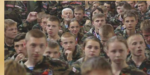
Детско-юношеские военно-патриотические, военно-исторические клубы