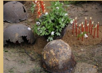
Детско-юношеские поисковые отряды