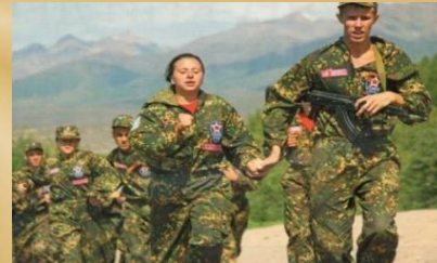
Всероссийские молодежные спартакиады по военно-прикладным видам спорта, сдача норм ГТО